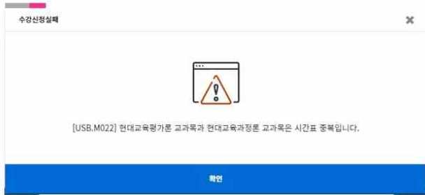
1. 시간표 중복 교과목이 있을 경우