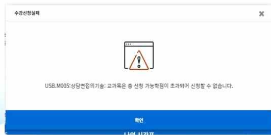
3. 해당학기 수강신청 가능학점 초과신청 불가

기타수강신청 메뉴 검색구분 기본검색에서 교과목명 혹은 교과목번호로 검색 → 혹은 검색구분 대학원강좌에서 개설학과 선택 후 조회 →