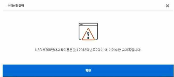
2. 기존에 이미 이수한 교과목일 경우